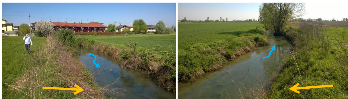
Figura 2: a sinistra ubicazione del punto di scarico visto da sud (freccia arancione), a destra visto da nord.

Le fotografie che seguono individuano il punto previsto per lo scarico.