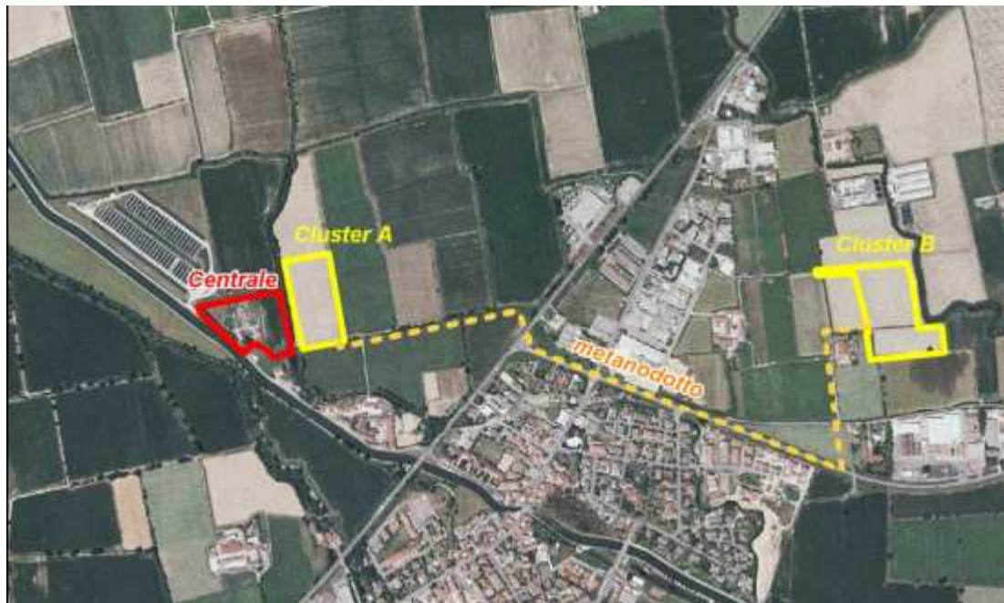
Figura 2: Ubicazione impianto Italgas (centrale e cluster)

Il Cluster A è adiacente all'area Centrale, mentre il Cluster B si trova a 1,8 chilometri di distanza ed è collegato attraverso un gasdotto.